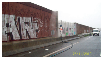
Situation initiale, début des travaux de gommage à l'archifine