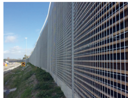
Exemple d'un aménagement déjà réalisé

Afin d'assurer la sécurité des intervenants, les conditions de circulation pourront être ajustées (par exemple la neutralisation d'une voie de circulation sur quelques kilomètres).