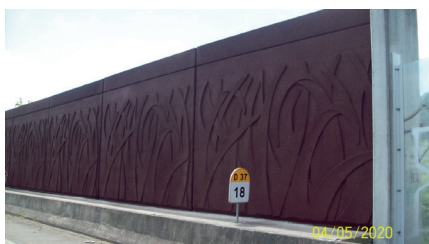
Après détagage, peinture et pose d'un film le 4 mai 2020.