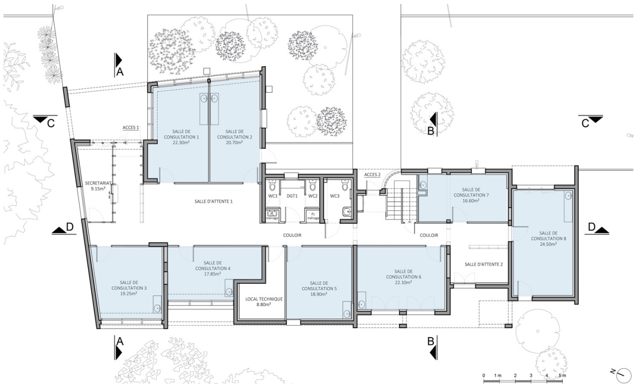
État projeté du plan du rez-de-chaussée © J.-B. LISSALDE Architectes D.P.L.G