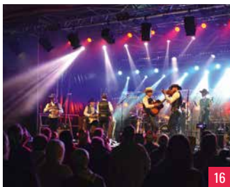
14. Pièce de théâtre jouée à La Fredonnière / 15. La Grange / 16. Festival Luynes à l'assaut de l'Amérique