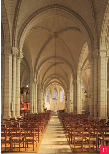
10. La cave troglodytique du jeu de boule de fort de la société « Les Grandes Bottes » / 11. Nef de l'église Sainte-Geneviève